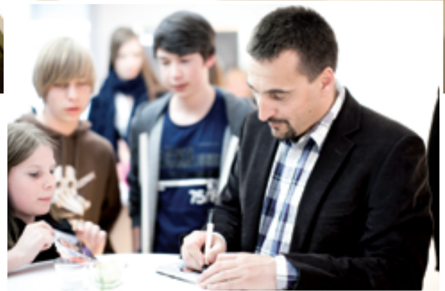
Der mehrmalige Olympiasieger im Rodeln, Georg Hackl, bei der Eröffnung des Zentrums