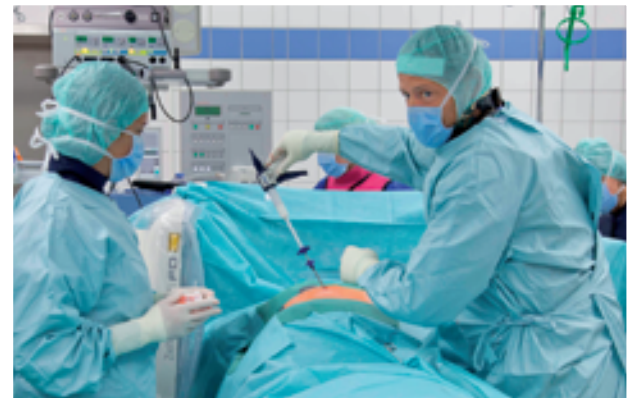
Die Silikon-Elastoplastie® revolutioniert die Operation von osteoporotischen Wirbelkörper-Frakturen