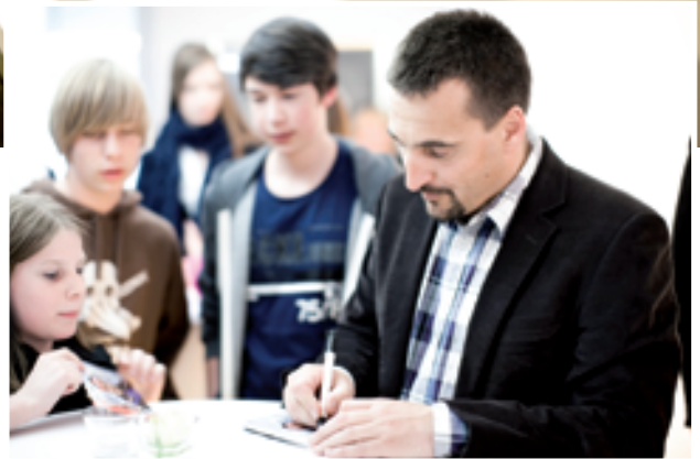
Der mehrmalige Olympiasieger im Rodeln, Georg Hackl, bei der Eröffnung des Zentrums